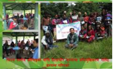
फिल्ड स्तरीय कोषिबुको लागि कार्यालय परिसरमा अभिमुखिकरण गोठि सम्पन्न गरिएको