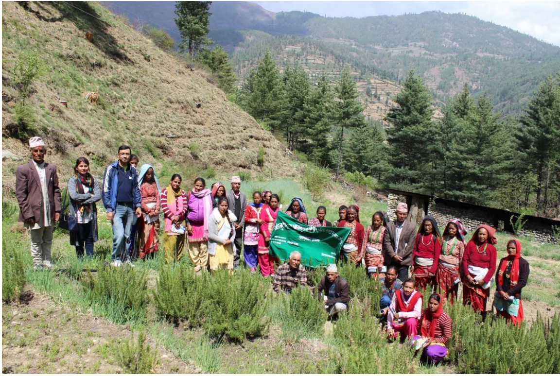
प्रचार प्रसार सामग्री उत्पादन ३० प्रजाति का जडिबुटीको पोस्टरहरु तयार गरिएको