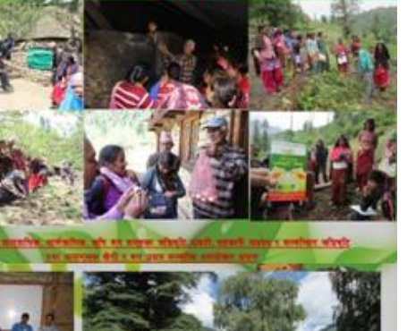
सकस्यपूर्ण अवस्थामा पुगेका अडिबुटी प्रजातिका सारसभान संरक्षण