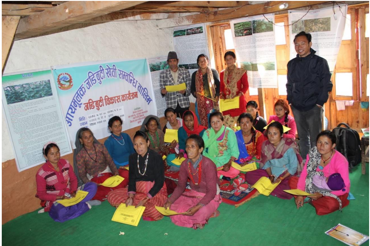
आयमूलक जडिवुटी खेति तथा प्रशोधन र भण्डारण सम्बन्धि तालिम का सहभागीहरुको सामुहिक फोटो