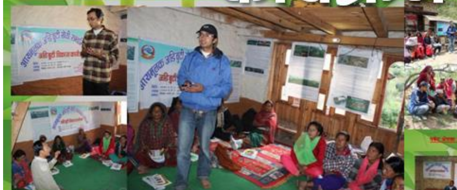
आयुमलक अडिबुटी बोली, प्रशासन तथा सन्धारण सम्बन्धी तालिम