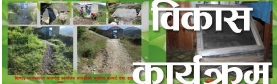
विचार व्यवस्थापन कार्यको कार्यालय अडिबुटी नर्सरीमा अडिबुटी तथा बा