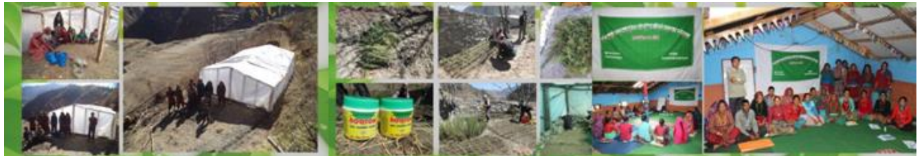
पसेट भोक्पा अडिबुटी नर्सरी व्यवस्थापन अर्थात संस्थापन