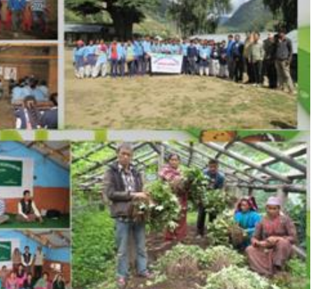
सकस्यपूर्ण अवस्थामा पुगेका अडिबुटी प्रजातिका सारसभान संरक्षण