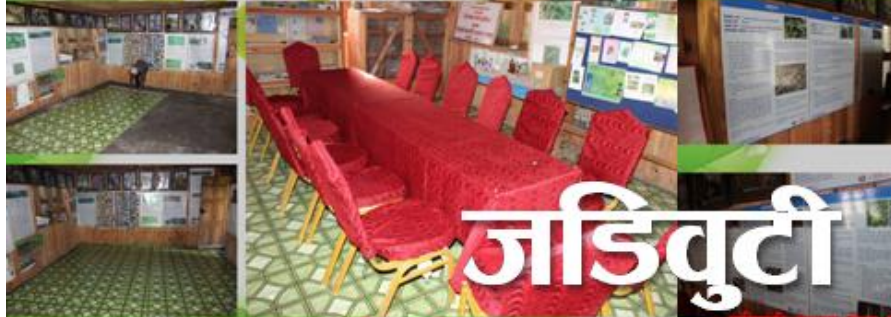
सुचना कक्ष कार्पेट हाल्ने काम