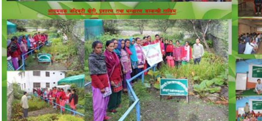
फिल्ड स्तरीय कोषिबुको लागि कार्यालय परिसरमा अभिमुखिकरण गोठि सम्पन्न गरिएको